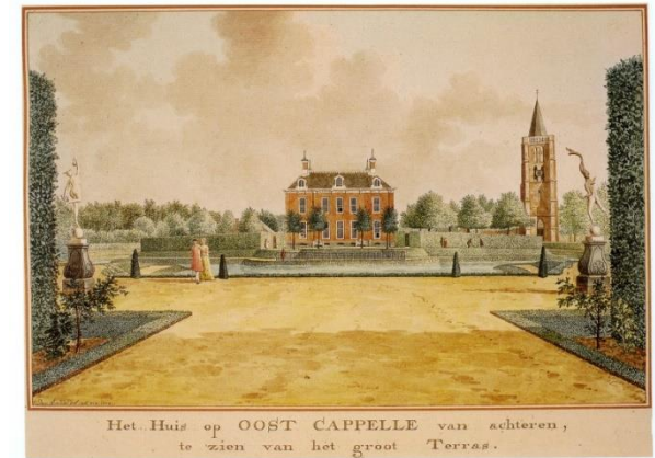
Het Huis op OOST CAPPELLE van achteren, te zien van het groot Terras.

Enkele bronnen: 'Jan Arends, buitenplaatsen op Walcheren', Martin van den Broeke, Canaletto/Repro-Holland, 2001 en 'De Rembrandts van Oostkapelle'- Th. Laurentius - Drukkerij Zoetewij Yerseke, 2006.