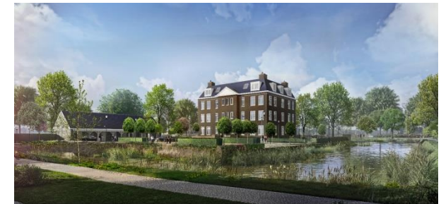
HUIS TE OOSTKAPELLE

Een uniek stukje Oostkapelse historie is nieuw leven ingeblazen!